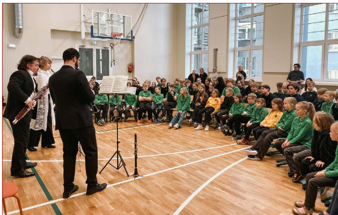
4. märtsil käis Kaarli Koolis Eesti Riikliku Sümfooniaorkestri puupuhkpillitrio. Orkestrimuusikud tutvustasid oma pille ning esitasid meeleolukat prantsuse muusikat.