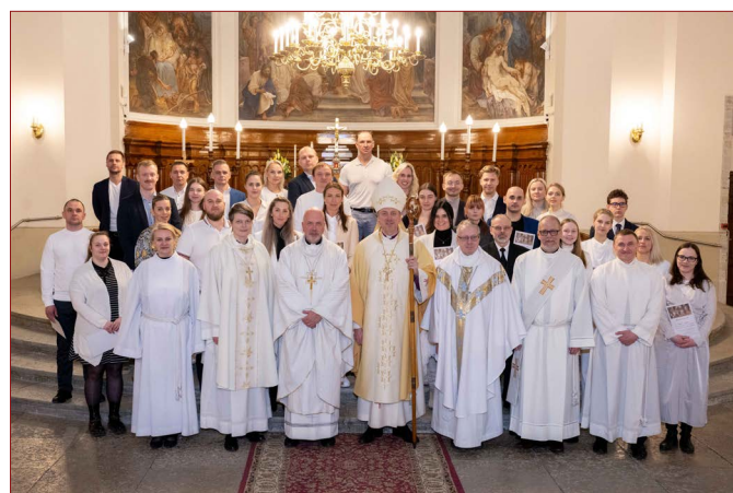
Ülestõusmisöö vigiilia 30. märtsil algas Kaarli kirikus enne keskööd ülestõusmispüha valguse süütamisega kiriku esisel platsil ning üksteisega jagatud tulega suunduti kirikusse. Missa käigus ristiti ja konfirmeeriti kolmkümmend üks uut koguduse liiget.