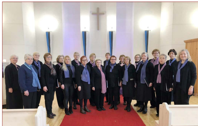
Palmipuudepäeval 25. märtsil laulis Kaarli naiskoor jumalateenistusel Tallinna Peeteli kirikus. Hea akustikaga ruum, kus on väga mõnus laulda.