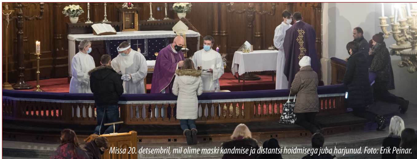
Missa 20. detsembril, mil olime maski kandmise ja distantsi hoidmisega juba harjunud.

summa on suurenenud ja siinkohal eriline tänu kõikidele annetajatele. Liikmeannetajaid oli möödunud aastal 1725 (2019. aastal oli 1776). Kõige suurem osa annetajatest on 45–64 aastased (549 inimest). Keskmine annetuse suurus oli 89 €.