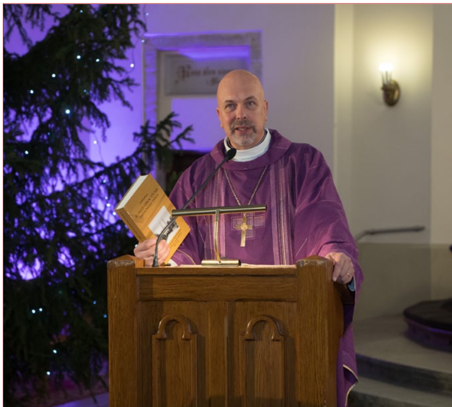
Peale jumalateenistust toimus koguduse aastapäevaks ilmunud jutlustekogu “Su palve viiok tõuseb taeva poole tänus” esitus. Kõik kaastöötajad, keda sel päeval tänati, said raamatu endale kingituseks